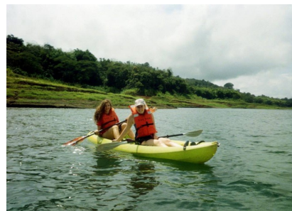
Kayaking on Lago Arenal

“...yo tuve muchas oportunidades inolvidables para experimentar la cultura de aventura de Costa Rica por actividades como ziplining y hacer excursiones por la selva...”