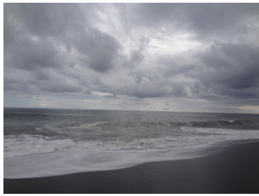
A beautiful evening view from our dining area at the Hotel Terraza