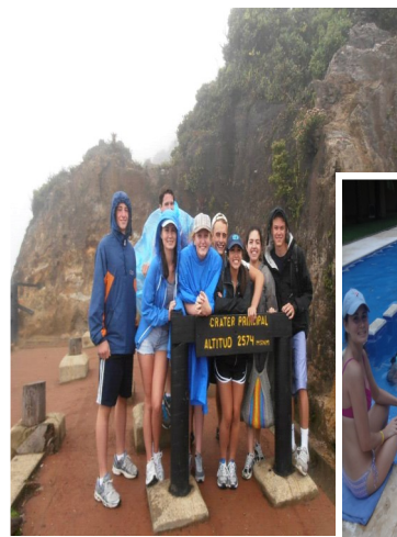
Hike on Mount Arenal