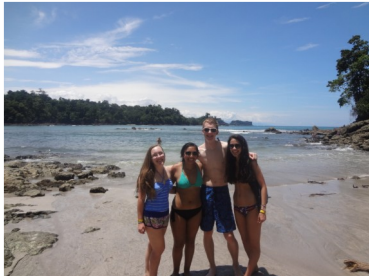
Relaxing with new friends at Manuel Antonio Biological Reserve