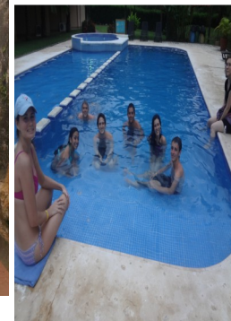
Poolside fun at the hotel

“...yo tuve muchas oportunidades inolvidables para experimentar la cultura de aventura de Costa Rica por actividades como ziplining y hacer excursiones por la selva...”