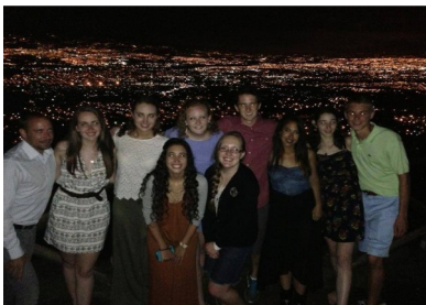
Our farewell dinner took place at a restaurant with an overlook onto all of San Jose. We enjoyed dinner, dancing, and spending our last night in Costa Rica with great friends.